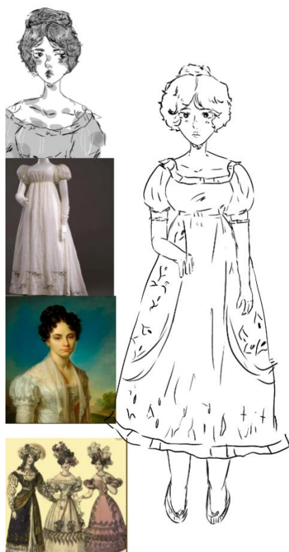
Мария Николаевна Волконская (первоначальный набросок)

Персонажей в моём комиксе не так много и конечно внешности главной героини - Марии было уделено особенно много времени. По моему мнению она получилась похожей на Марию Волконскую.