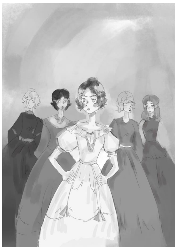
Первоначальный вид обложки

После завершения прошлых задач следует приступить непосредственно к самому созданию комикса: детальной прорисовке раскадровки, отрисовке страниц и реплик персонажей, проработке обложки. Это самый важный и конечный этап, после которого можно сказать, что цель нашего проекта в полной мере выполнена.