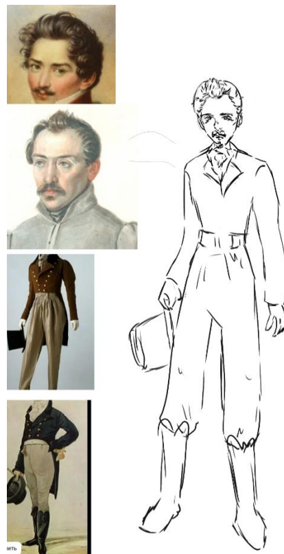
Сергей Григорьевич Волконский (первоначальный набросок)