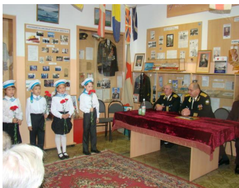
Рис. 2. Встреча с ветеранами

работа с местным населением. Ежегодно в школе проводятся акции, посвящённые победе советского народа в Великой Отечественной войне («Свеча памяти», «Бессмертный полк»), операции «Мы перед памятью в долгу», встречи с ветеранами войны, тружениками тыла, организуются экскурсии по местам былых боёв. Вся проводимая работа в этом направлении способствует пополнению фондов музея.