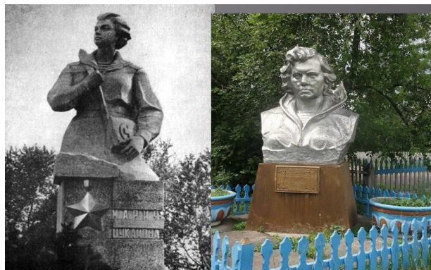
Рис 5. Памятники Марии Цукановой во Владивостоке и городе Фокино Приморского края

Память - увековечение имени Героя Советского Союза в мемориальных объектах