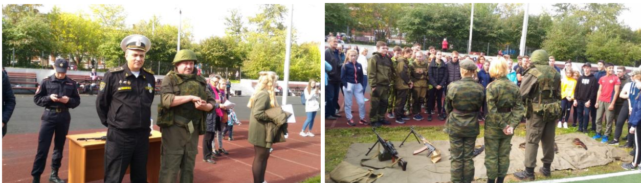
Рис.8. Окружные военно-спортивные состязания памяти Марии Цукановой в школе №75