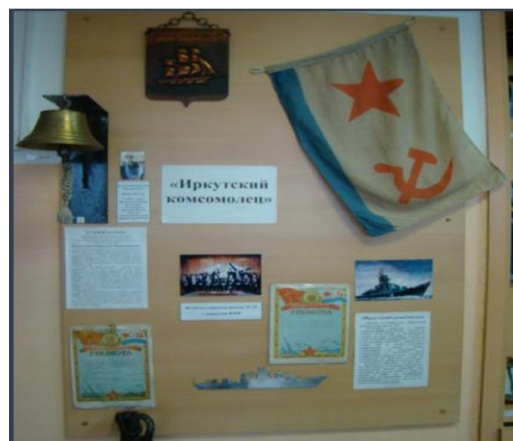
Рис. 1. Экспонаты музея школы № 75

Одним из основных критериев в оценке работы музея является разнообразие форм массовой и учебно-воспитательной работы: проведение экскурсий и уроков по экспозиции, встреч с участниками Великой Отечественной войны,