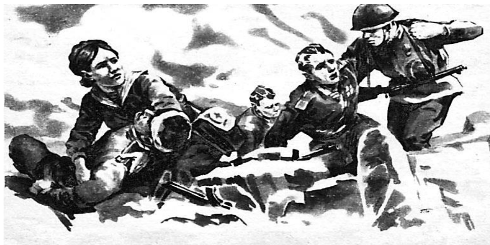
Рис.4. На поле боя

которого включили и старшего матроса Марию Цуканову. 14 августа батальону было приказано высадиться на корейский берег и захватить плацдарм для дальнейшего наступления на Сейсин, где находилась крупная японская военно-морская база.