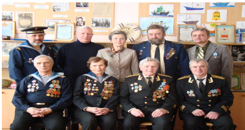
Рис.10. Встреча в музее школы 75

А также в музее школы постоянно проходят встречи с ветеранами военно-морского флота, на которых они делятся со школьниками воспоминаниями о годах службы, проводят беседы по патриотическому воспитанию.