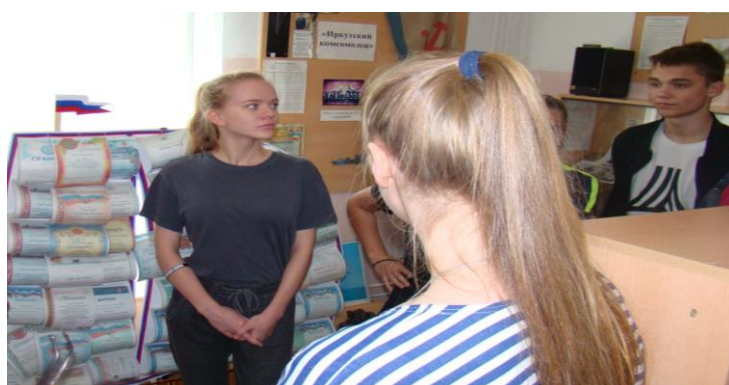
Рис.9. Экскурсия в музей Русского флота школы 75

А также в музее школы постоянно проходят встречи с ветеранами военно-морского флота, на которых они делятся со школьниками воспоминаниями о годах службы, проводят беседы по патриотическому воспитанию.