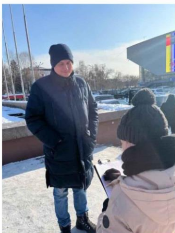
Фото проведения опроса на улице Ленина около памятника.

Приложение 2. Ссылка на фото проведения опроса: https://disk.yandex.ru/i/oqHcP7Lj4tUyGw