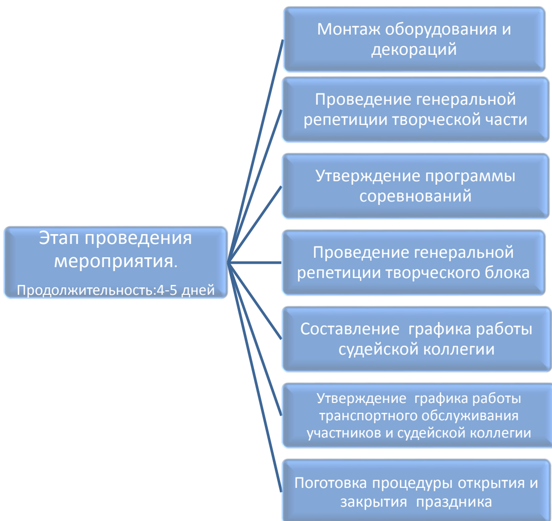
Рисунок 7. Структурная схема этапа проведения мероприятия в сооружении.