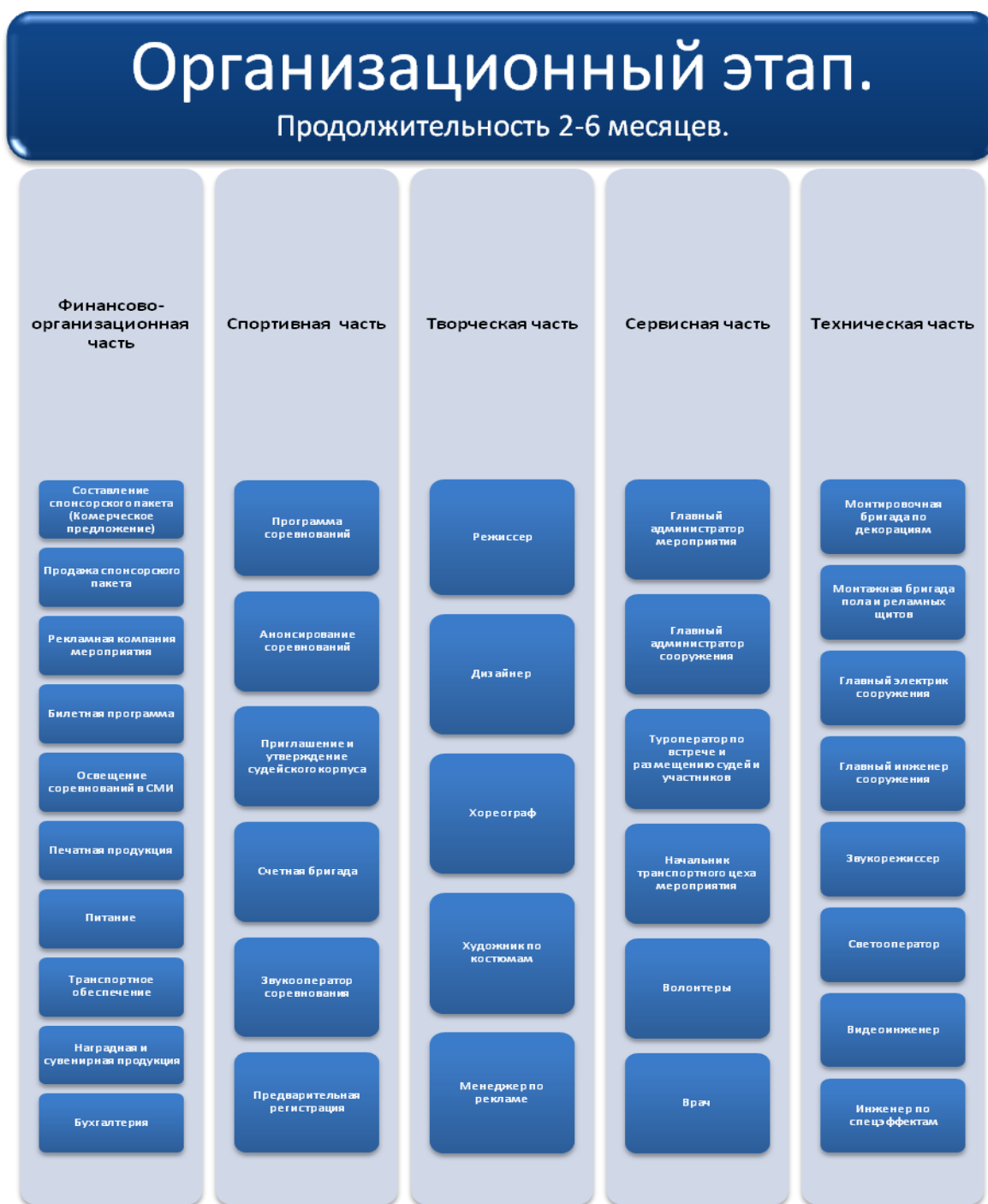
Рисунок 6. Структурная схема организационного этапа.