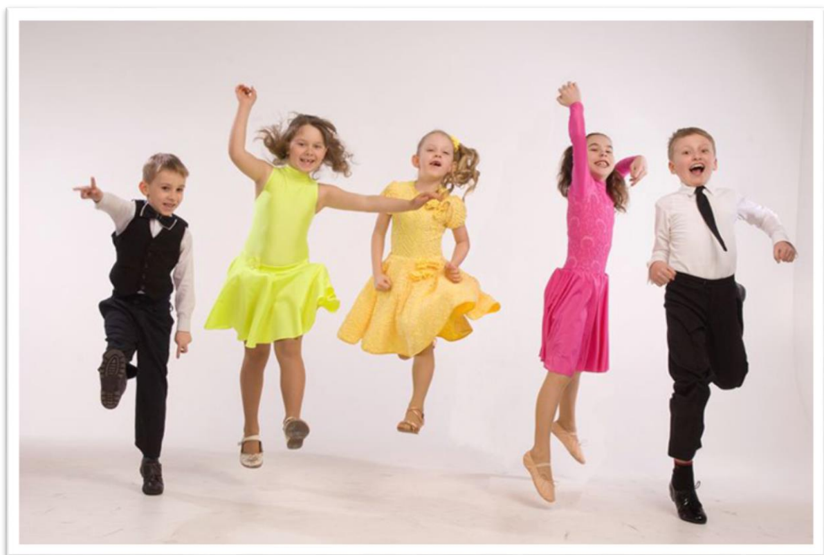
Рис 10. Календарный график проекта