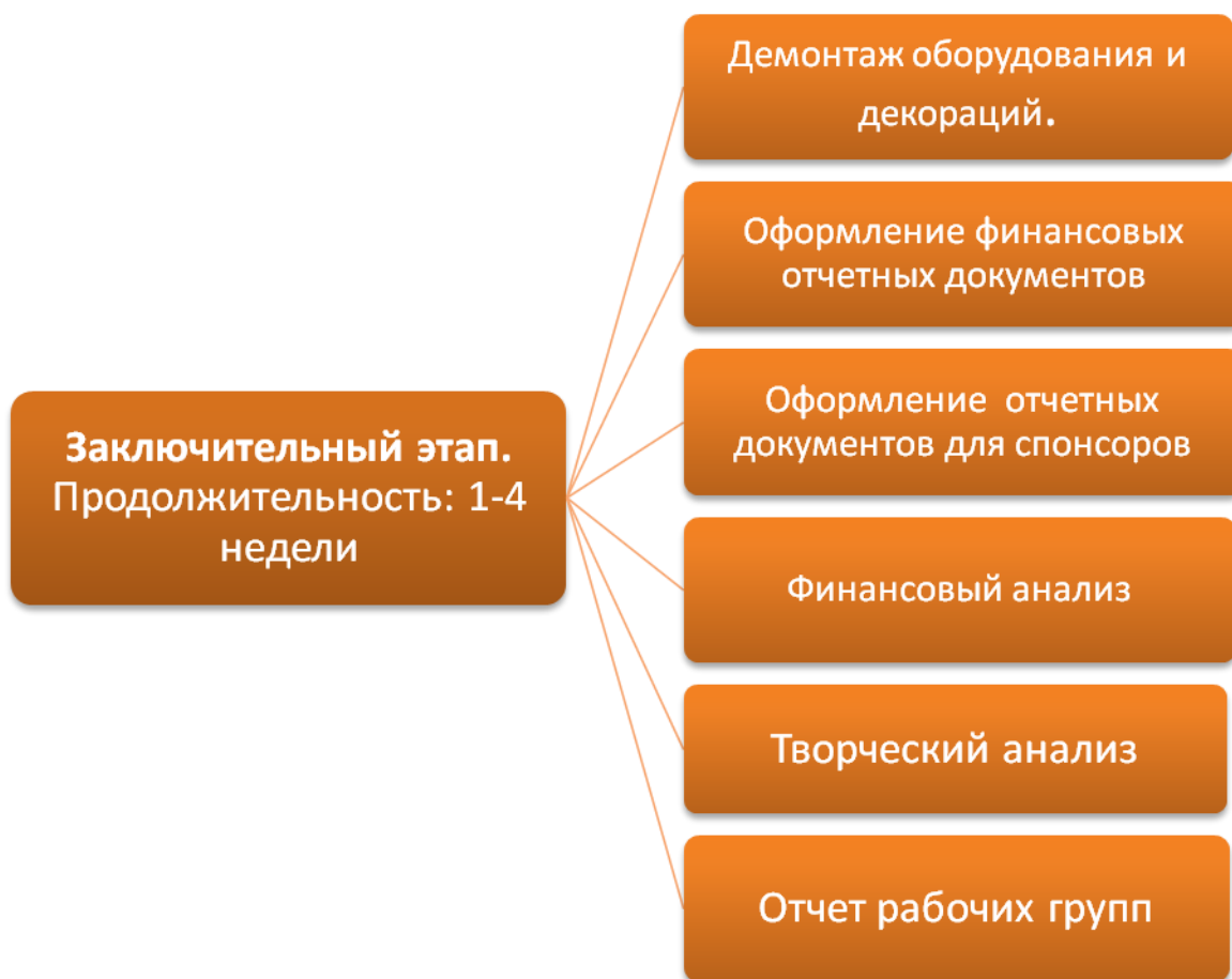
Рисунок 8. Структурная схема заключительного этапа проведения мероприятия в сооружении.