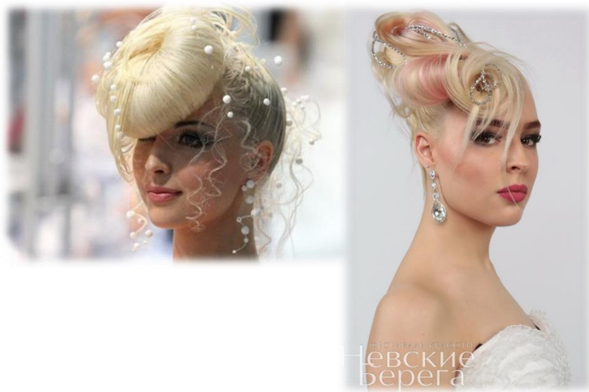
Салонная свадебная прическа