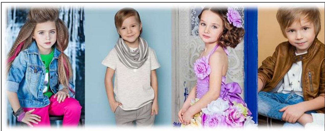
Полный модный детский образ