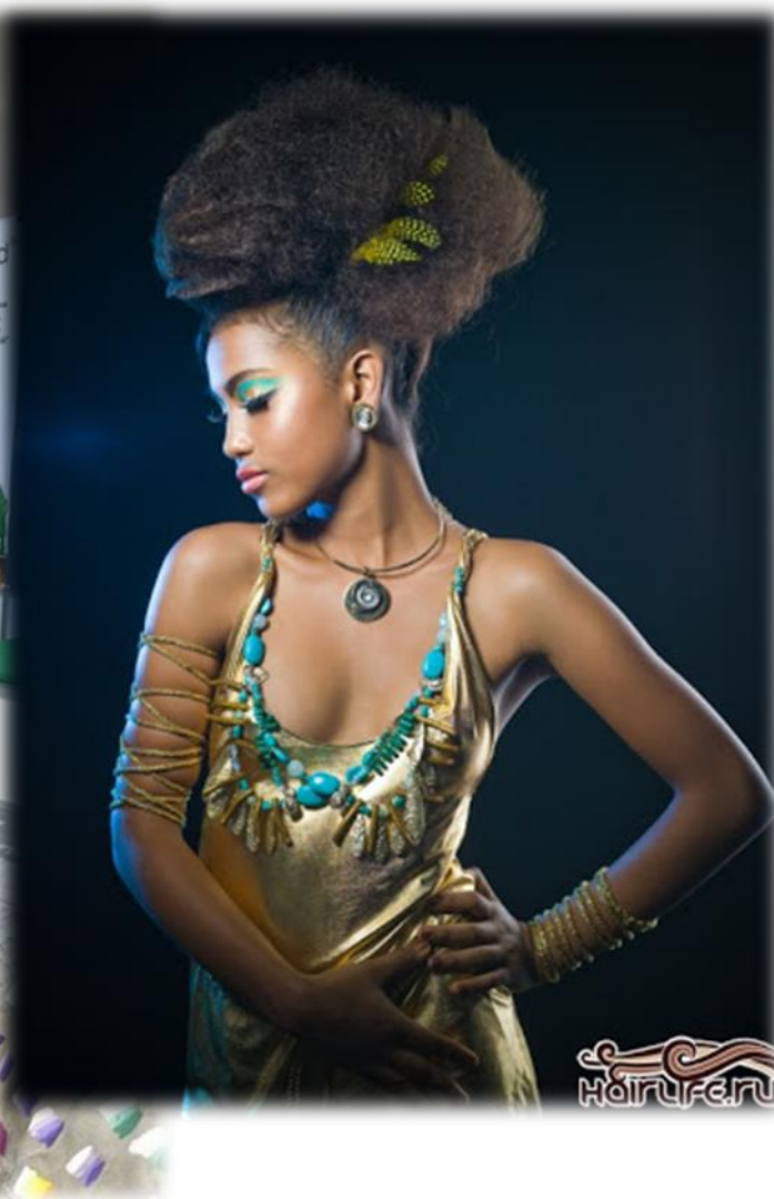
Полный модный образ