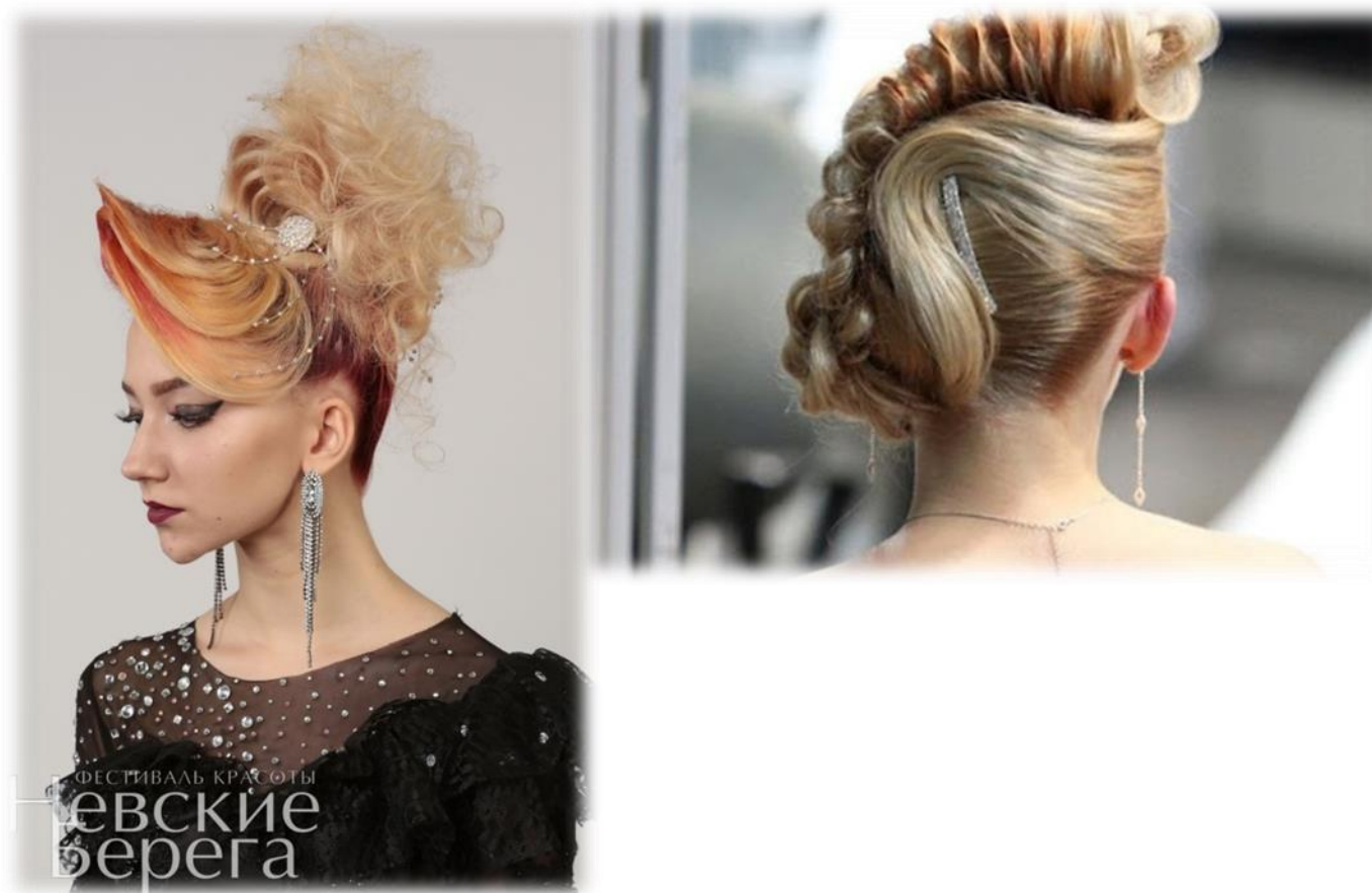
Модная вечерняя прическа