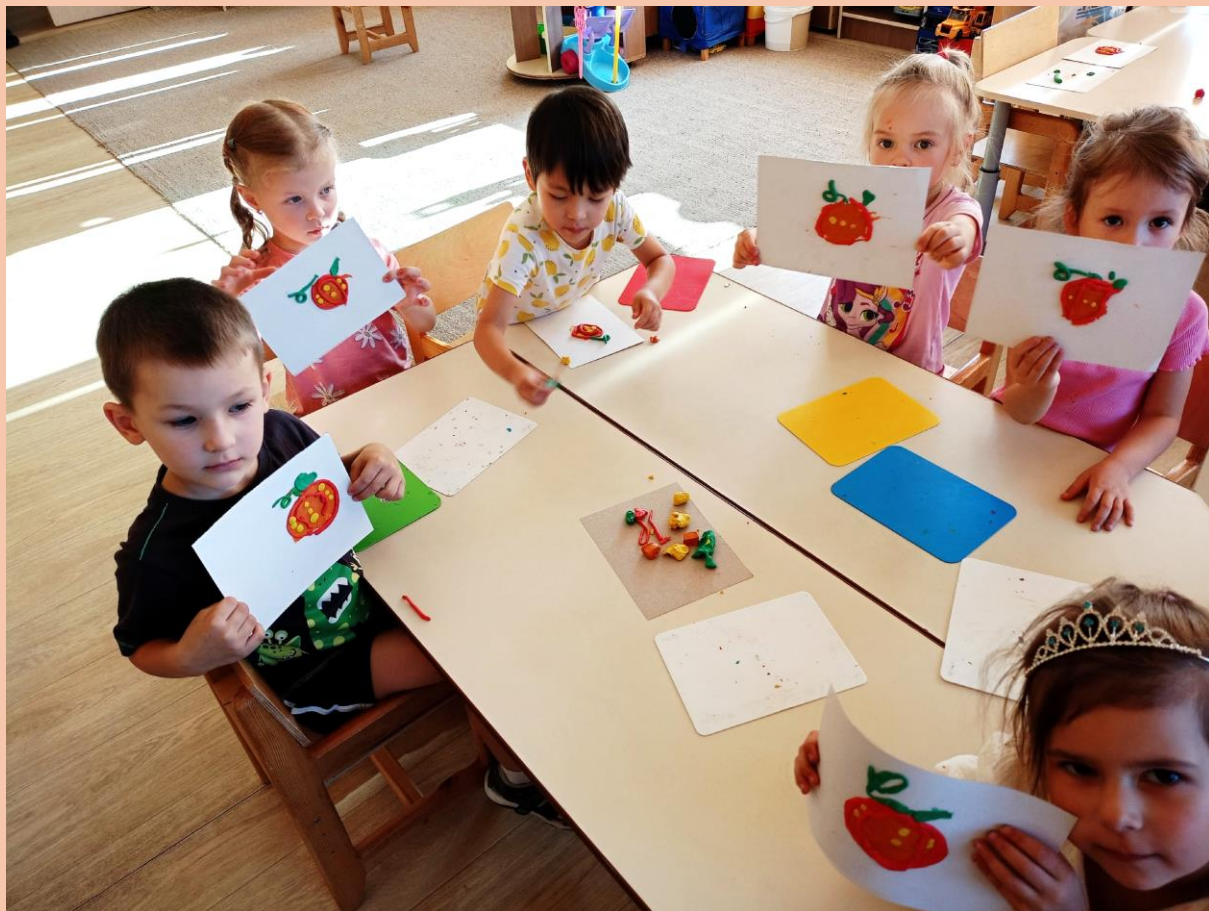
Работы детей в начале года