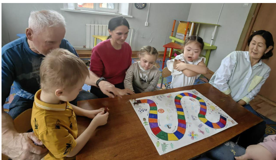
Рис. 1. Настольная игра «Разноцветная дорожка»

Раздаточный материал: карточки с заданиями, карта, фишки, разноцветный кубик (Приложение 1).