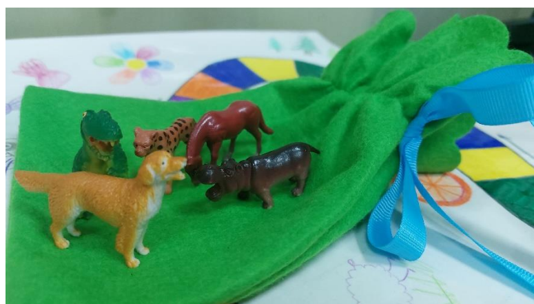
Рис. 3. Фишки