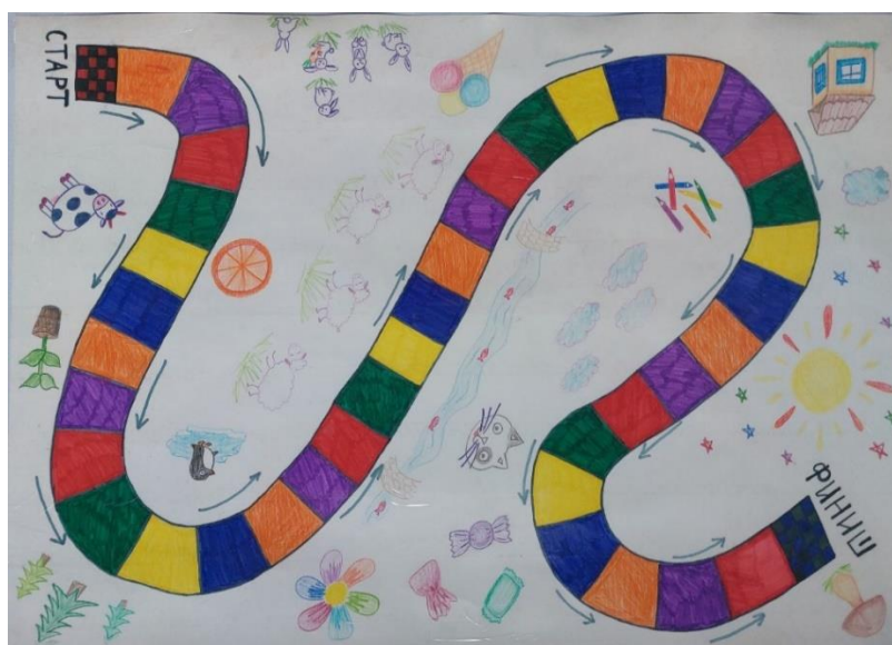
Рис. 2. Игровое поле